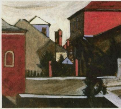
Καρμής (1999), ακρυλικά σε ξύλο με πανί. Ιδιωτική συλλογή.