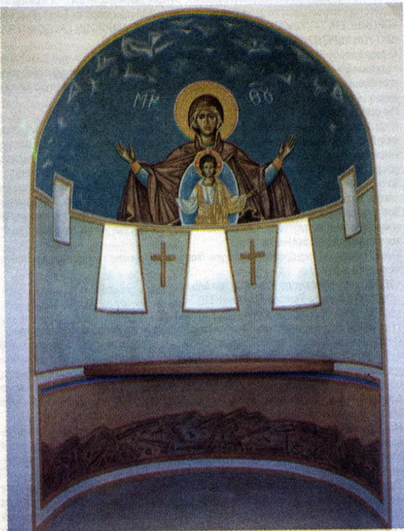
ΠΛΑΤΥΤΕΡΑ ΑΓ. ΝΙΚΟΛΑΟΣ ΜΥΚΟΝΟΣ

Ο Μάρκος Καμπάνης εκτός από ζωγράφος και χαράκτης έχει πλούσιο έργο και στον τομέα της εκκλησιαστικής ζωγραφικής κυρίως σε τοιχογραφίες και εικονογραφίες σχετικών βιβλίων. Η εργασία του σε ναούς ή μοναστικά ιδρύματα περιλαμβάνει τοιχογραφίες στις μονές Σίμωνος Πέτρα και Βατοπαϊδίου του Αγίου Όρους, στην Μονή Παναγίας Πορταΐτισσας στον Έβρο μετοχίου της Μονής Ιβήρων, στη μονή Αγίας Αικατερίνης του Όρους Σινά, και σε ιδιωτικά παρεκκλήσια. Ζωγραφίζει συνήθως απευθείας στον τοίχο με χρώματα καζέϊνης και αυγού ή με σύγχρονα υλικά όπως ακρυλικά ή υδρόαλο. Παράλληλα εικονογραφεί εκδόσεις εκκλησιαστικού περιεχομένου με κυριότερη την εικονογράφηση του Νέου Συναξαριστή των εκδόσεων Ίνδικτος. Για το εκκλησιαστικό του έργο έχει γραφτεί ότι « η ζωγραφική του ενσθησία εμβολιάζει το αγιογραφικό του έργο με τρόπο απρόσμενο και ανανεωτικό. Είναι εμφανής μια έντονη ζωγραφικότητα που τον προστατεύει από την παγίδα της πιστής αντιγραφής ή της επιφανειακής γραφικότητας» (Γ. Καλόφωνος). Ο Δημήτρης Κωνσταντίος έχει αναφερθεί στην φρεσκάδα με την οποία αντιμετωπίζει την ορθόδοξη αγιογραφία και τον κατατάσσει στους ανανεωτές της εκκλησιαστικής ζωγραφικής «με την έννοια ότι πατά γερά στην παράδοση αιώνων χωρίς όμως να την χειρίζεται μιμητικά αλλά συνθέτοντας ένα προσωπικό ζωγραφικό παράδειγμα».