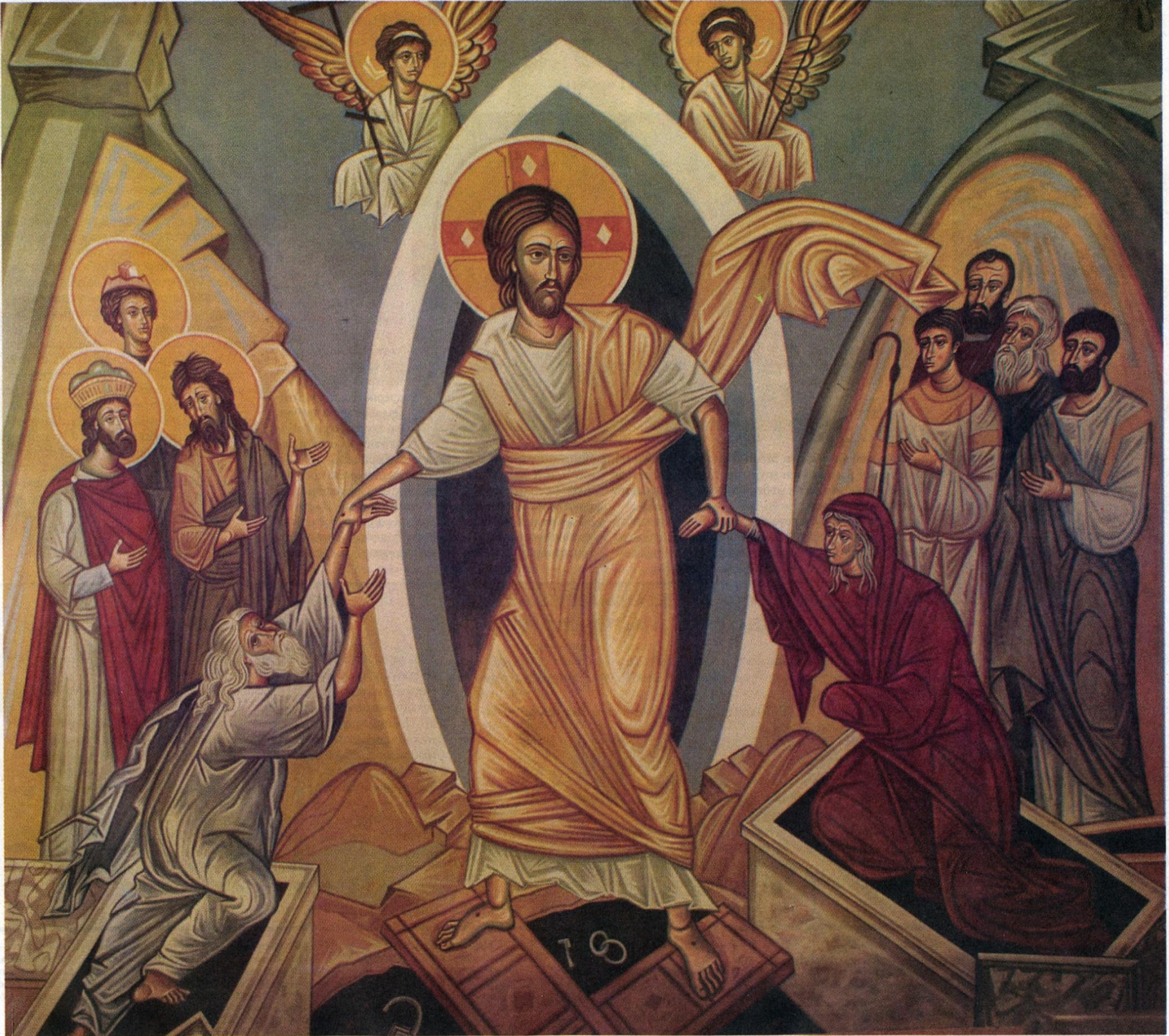
«ΑΝΑΣΤΑΣΗ», έργο του Μάρκου Καμπάνη

T: 210 38 17 700 - 210 38 17 716 - 210 38 17 737 F: 210 38 17 331 - 210 38 17 281 E: iho@otenet.gr W: www.ihodimoprasion.gr