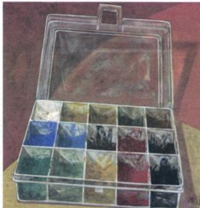
Σκόνες ζωγραφικής, 2013, ακρυλικό σε ξύλο

Διάρκεια έκθεσης ως 4 Μαΐου 2019. Ώρες λειτουργίας: Δευτέρα, Τετάρτη, Σάββατο 10.00 -19.00. Τρίτη, Πέμπτη, Παρασκευή, 10.00-21.00. i-D Project Art: Κανάρη 12, Κολωνάκι, 10674 Αθήνα, τηλ. 2103221801. www.idconceptstores.com