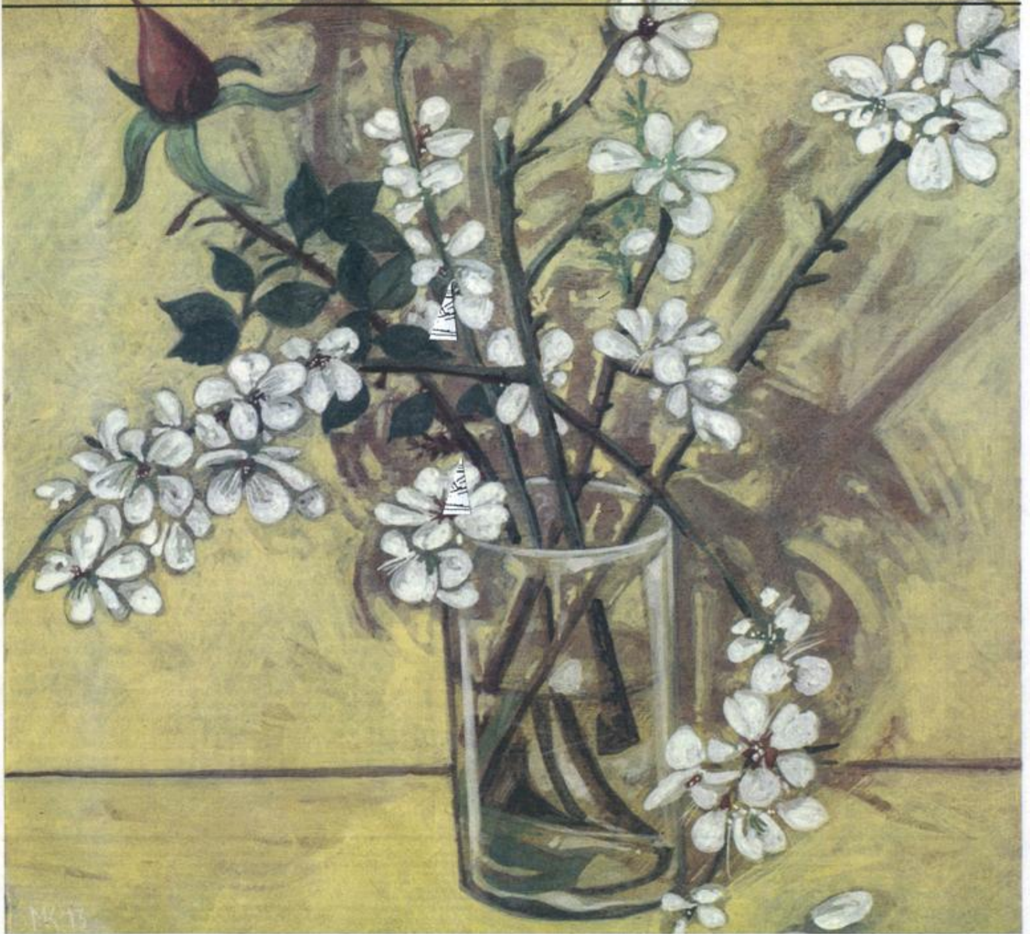
Έργο του Μάρκου Καμπάνη Λουλούδια, 2013, ακρυλικό σε ξύλο

T: 210 38 17 700 - 210 38 17 716 - 210 38 17 737 F: 210 38 17 331 - 210 38 17 281 E: iho@otenet.gr W: www.ihodimoprasion.gr