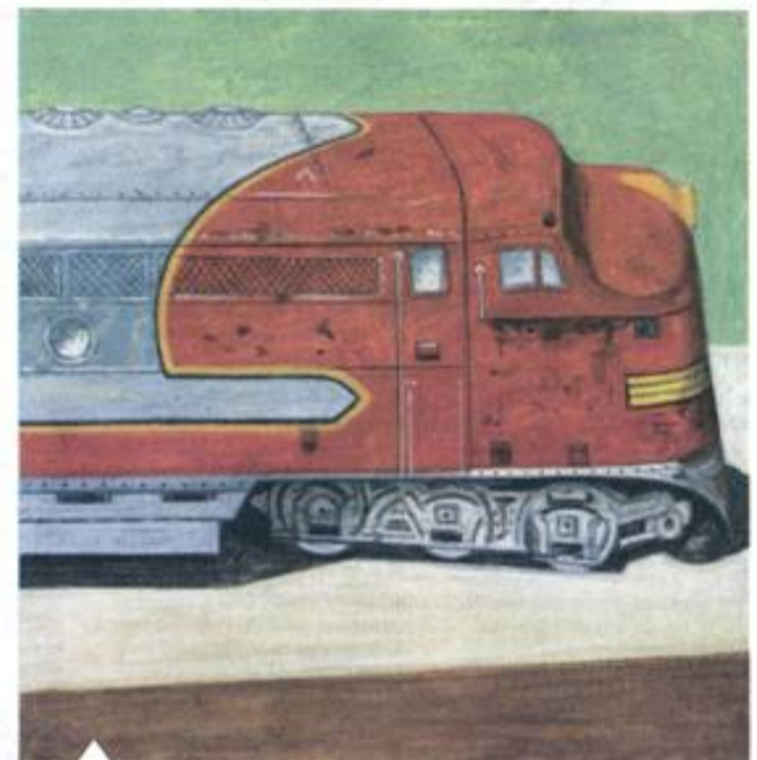
Τραί, 2013, ακρυλικό σε ξύλο